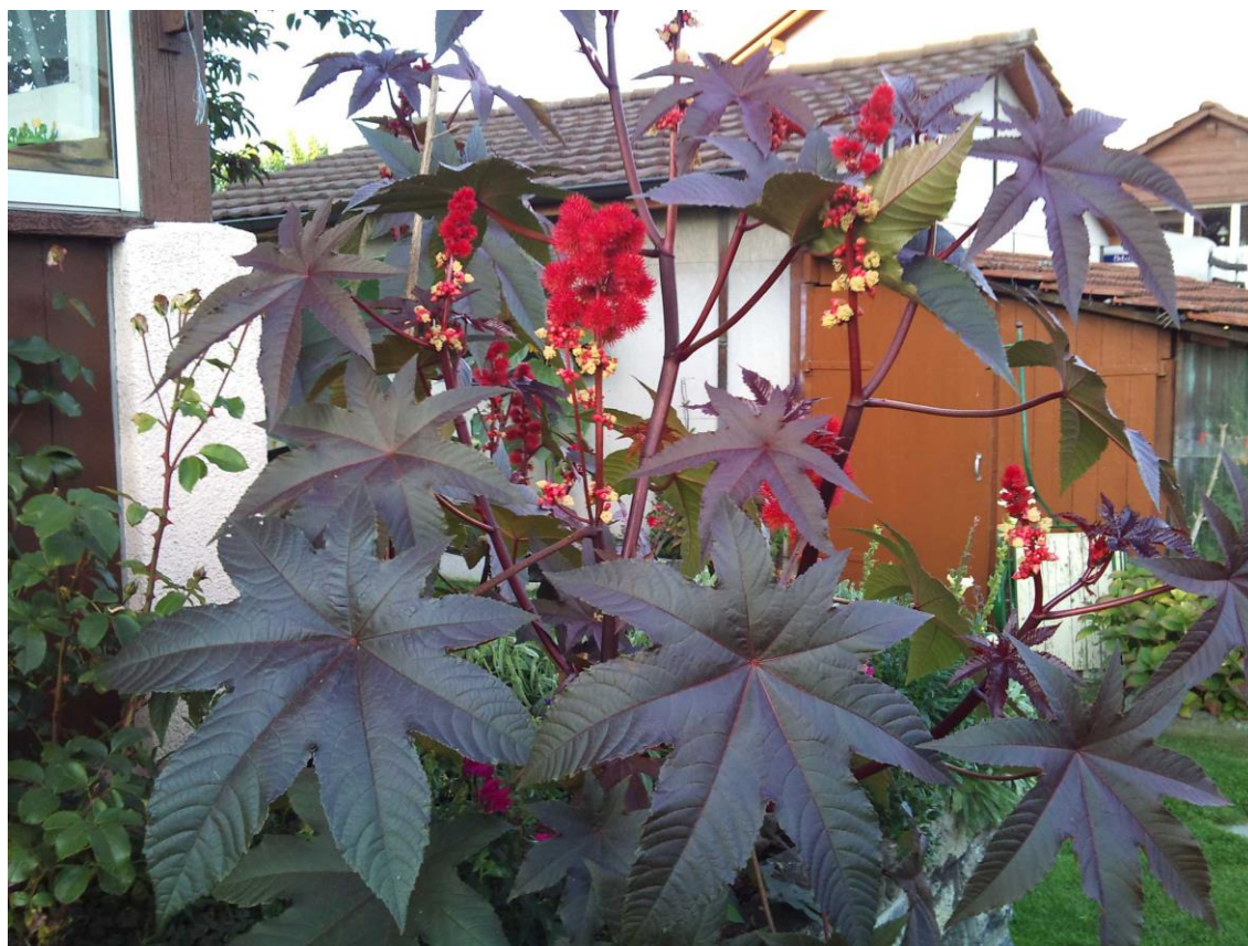
Herbstliche Farben in der BWG Friedheim