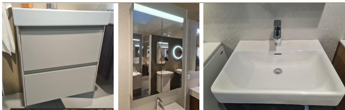
Impressionen der neuen Badezimmereinrichtungen